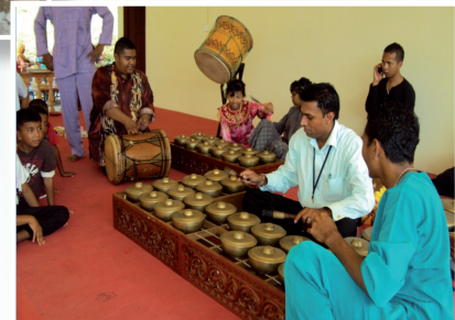
Pelancong berpeluang memainkan alat muzik

tersebut bukan sahaja didatangi oleh kelompok pelancong dalam negara sahaja, malah dari luar negaraturutmelawatkehomestay tersebut. (rujuk Rajah 1)