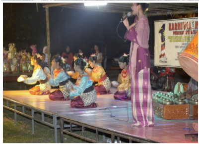
Persembahan Nyanyian dan Tarian Tradisional