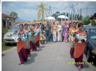
Majlis Perkahwinan Mengikut Adat Perpatih