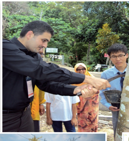
Aktiviti Menoreh Getah